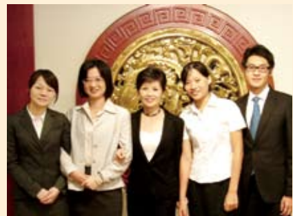
▲ 工作人員在典禮後合影留念。