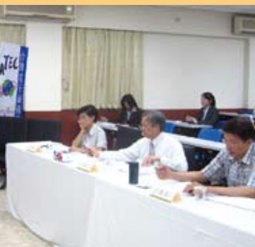
▲ 決賽各會場參賽者同時進行口頭報告，評審專注聆聽。