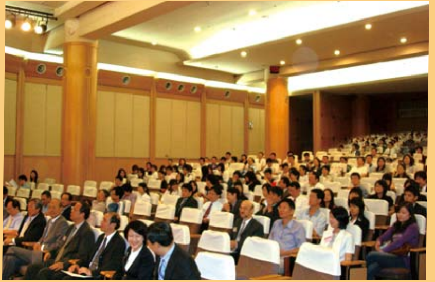
▲ 得獎者、評審貴賓以及社會各界人士逾兩百人蒞臨會場參與盛會。

此次活動計有來自全國近五百篇碩、博士論文參賽，經五十位大學教授初審、決賽評選後，最後精選出三篇碩士組、一篇博士組優勝論文。博士組最高獎金總額達十萬元，其中優勝同學獎金六萬元，指導教授四萬元。