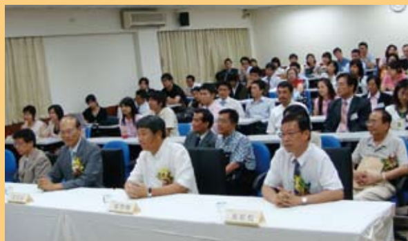
▲ 決賽當天，進行小型頒獎儀式，所有評審貴賓與參賽者齊聚一堂。