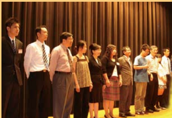
▲ 碩士一般管理B組佳作得獎者上台接受表揚。