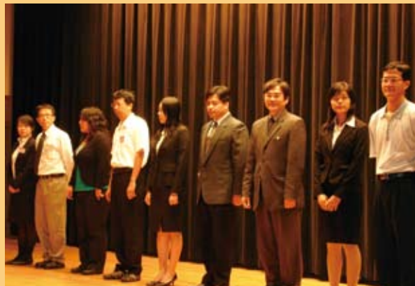
▲ 碩士一般管理A組佳作得獎者上台接受表揚。