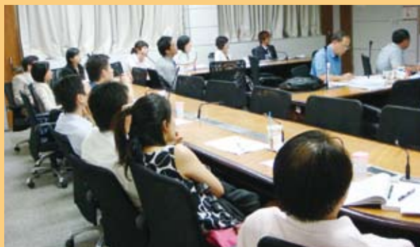
▲ 決賽會場坐滿參賽者與旁聽觀眾。